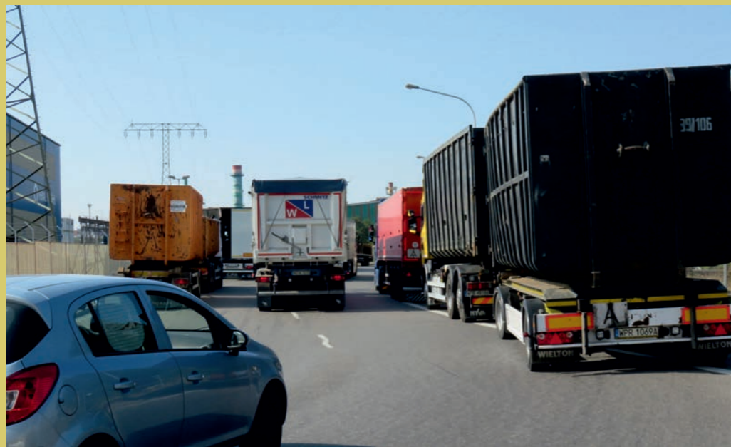
Unerträglicher LKW-Verkehr soll durch Hafenerweiterung erheblich ansteigen, auch nachts und an Wochenenden!