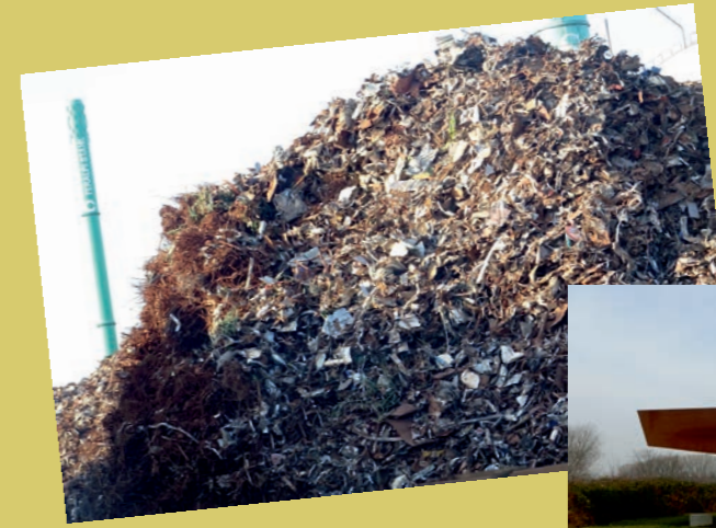
Riesa's „schönste“ Wahrzeichen Schrott