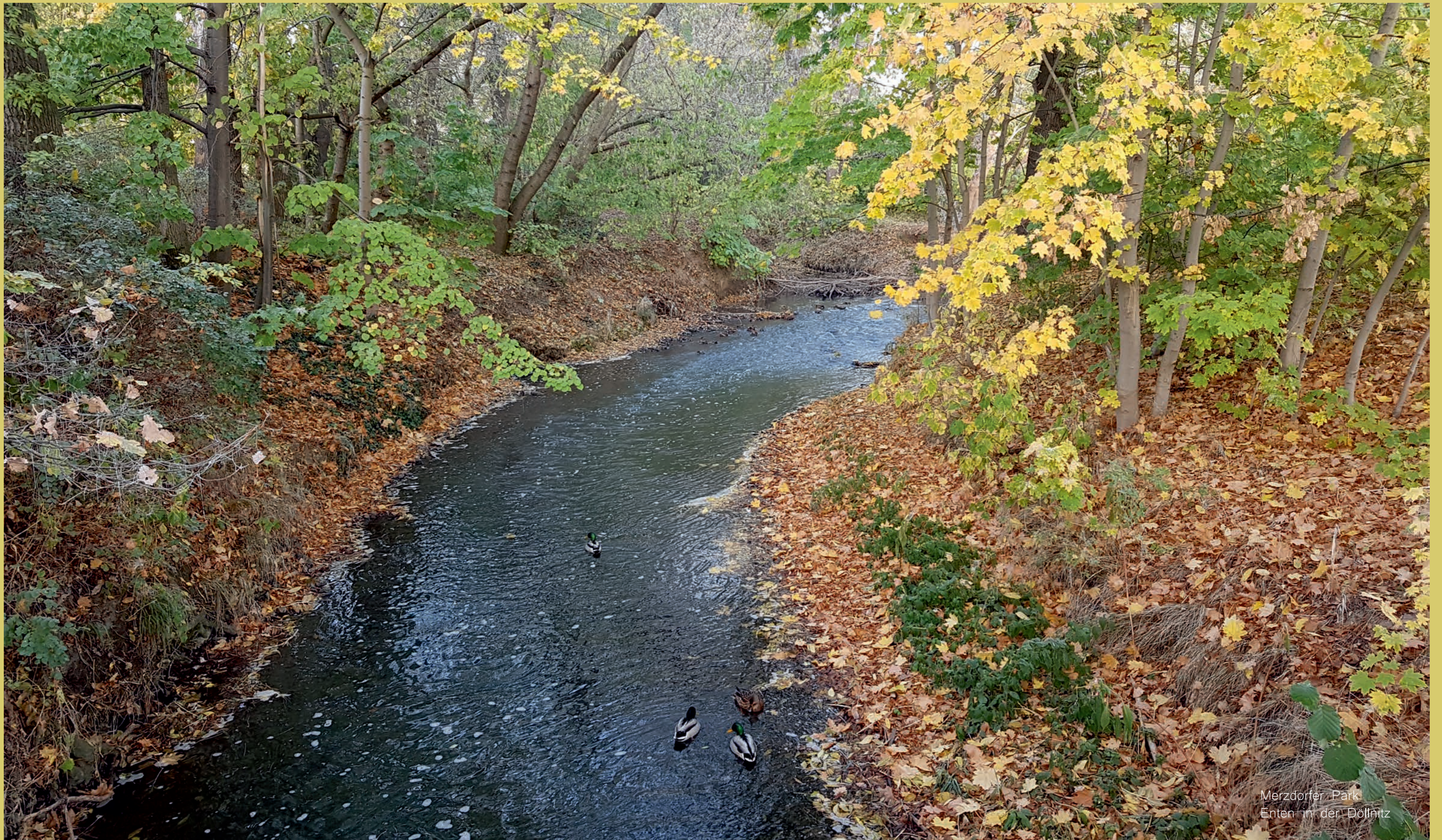
Merzdorfer Park Enten in der Döllnitz