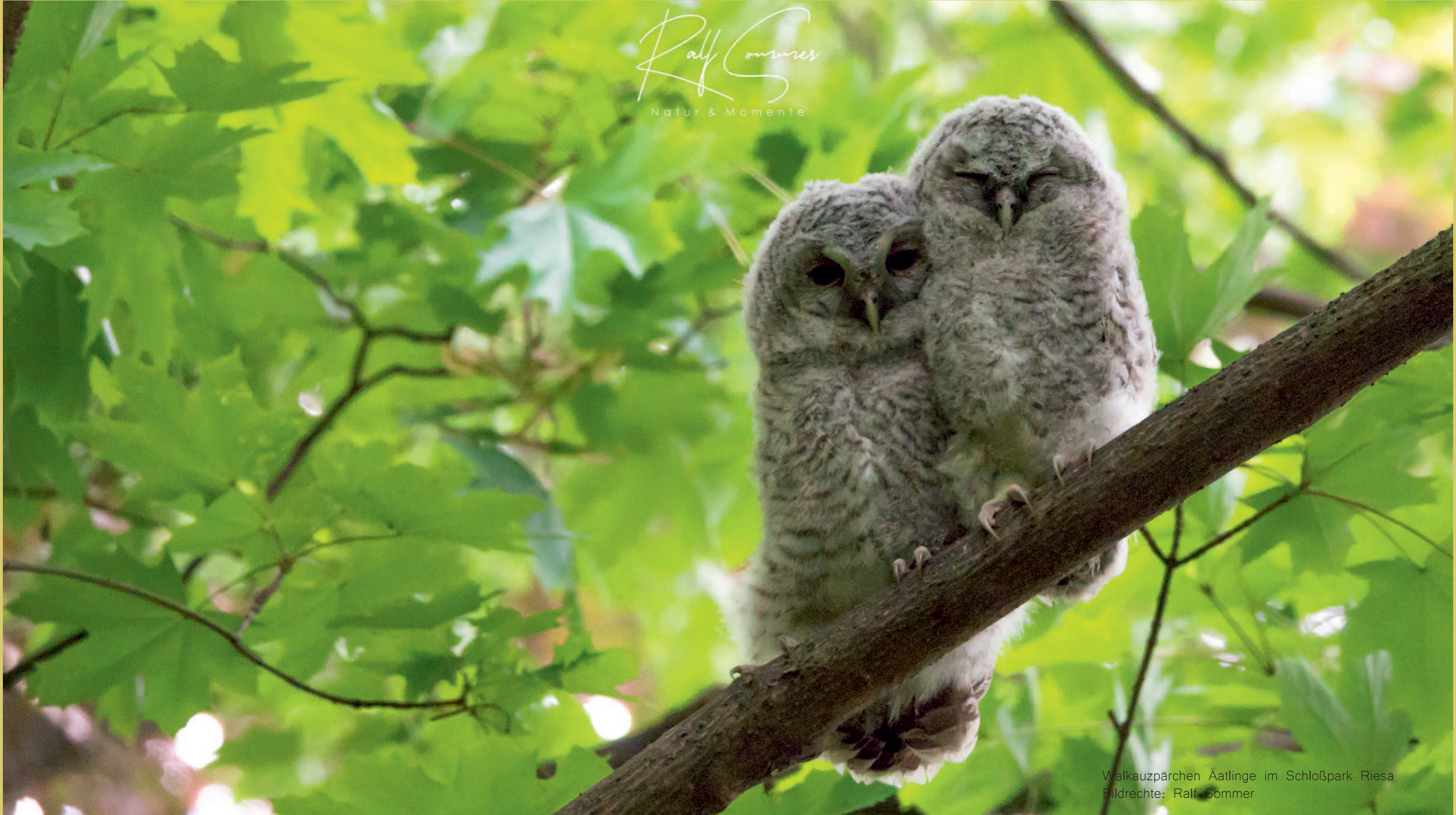
Walkauzpaarchen Ätlinge im Schloßpark Riesa