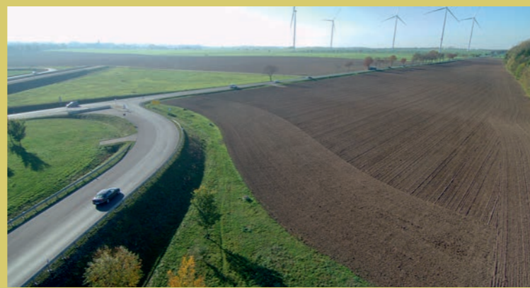
Kein Voranschreiten im Gewerbegebiet RIO seit 10 Jahren! Der alternative Standort an der B169 für einen LKW/Bahn KV-Terminal mit zusätzlichen Ausbaupkapazitäten