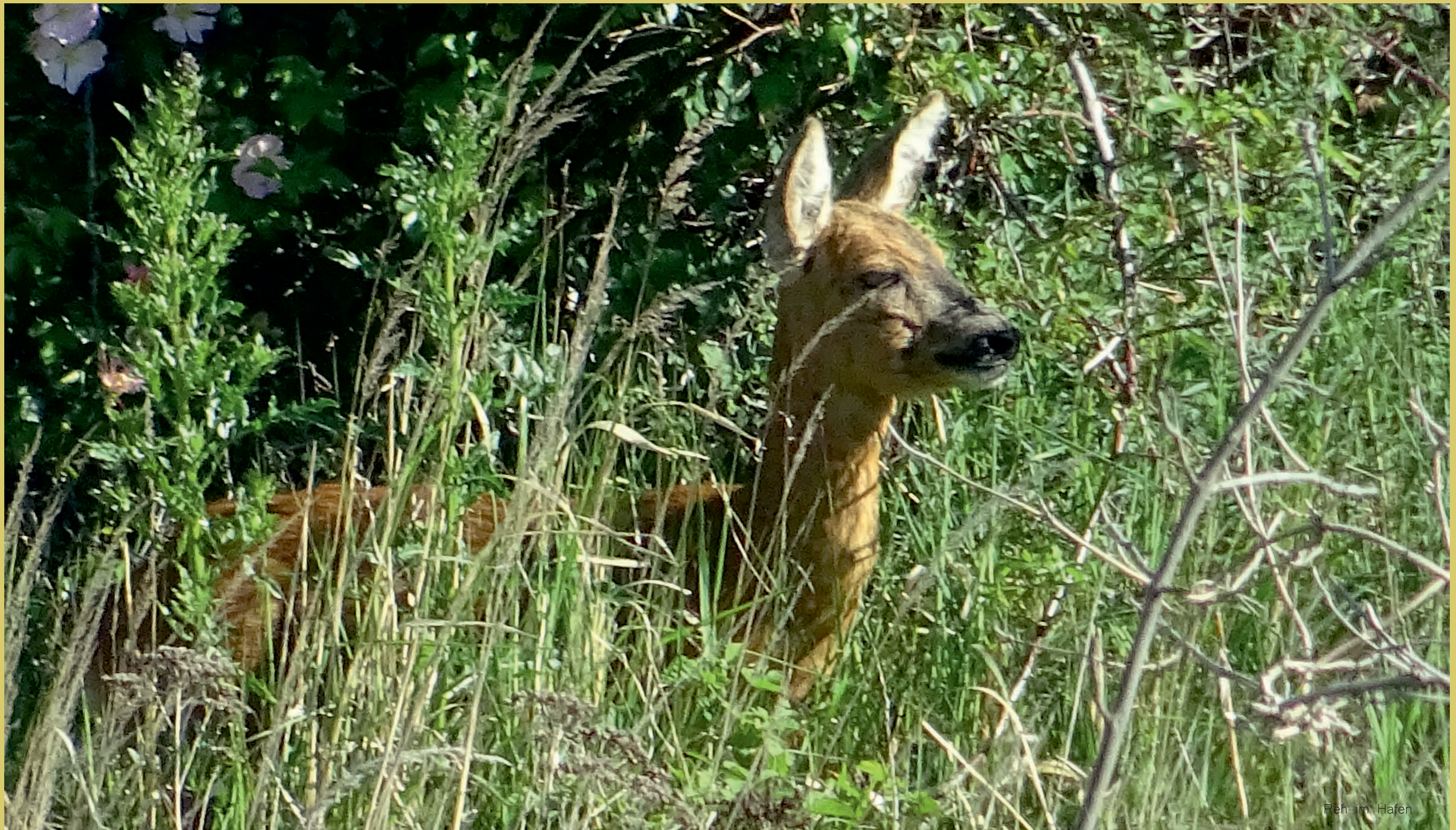
Reh im Hafen