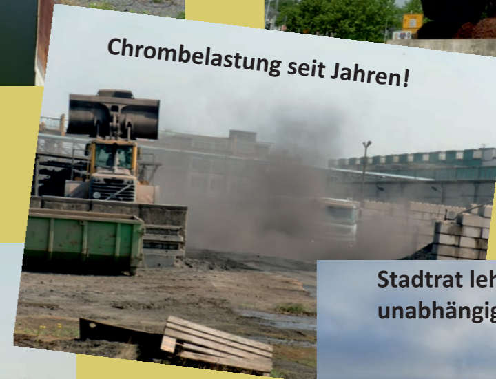
Chrombelastung seit Jahren!