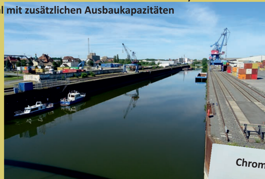
Der Riesaer Hafen mit einem Schiffsverkehr von weniger als 5%!

Die WGR finanziert den monatlichen Pachtzins für den Riesenhügelkomplett. Statt dem bis 31.12.2003 gültigen Pachtzins von 23500 € wurden seit 2004 nur noch 1000 € durch die Magnet GmbH gezahlt. Das sind jährlich 270'000€ und in 16 Jahren immerhin 4'320'000 €. Das bemängelte der Rechnungshof 2019!