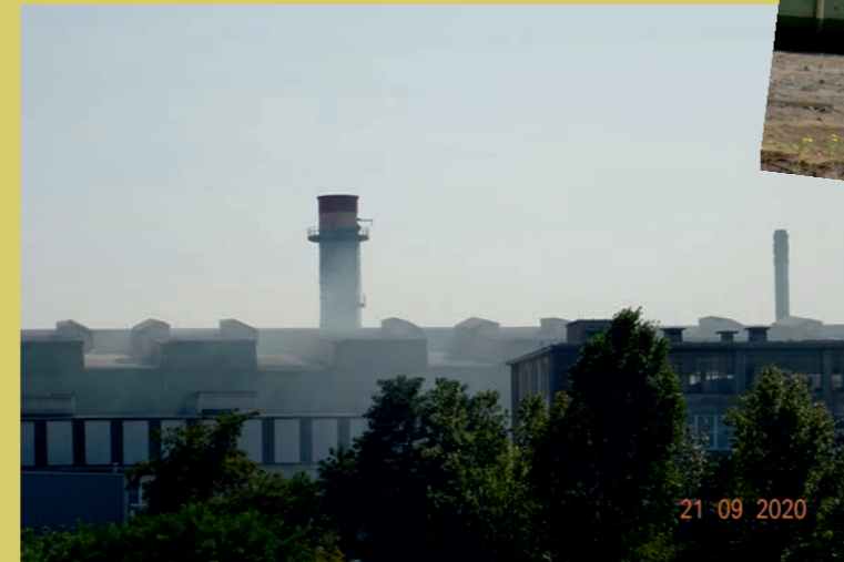
Nicht genehmigter ungefilterter Giftstaub aus dem Stahlwerksdach