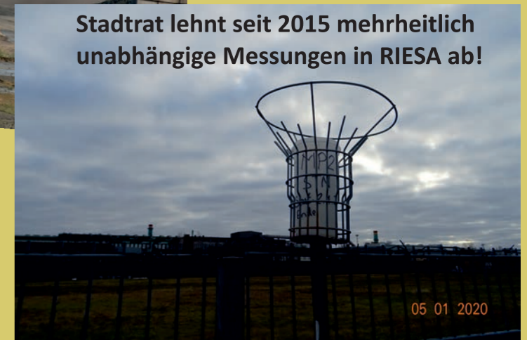
Stadtrat lehnt seit 2015 mehrheitlich unabhängige Messungen in RIESA ab!

„Im übrigen gilt ja hier derjenige, der auf den Schmutz hinweist, für viel gefährlicher als der, der den Schmutz macht.“ Warum auch in RIESA?