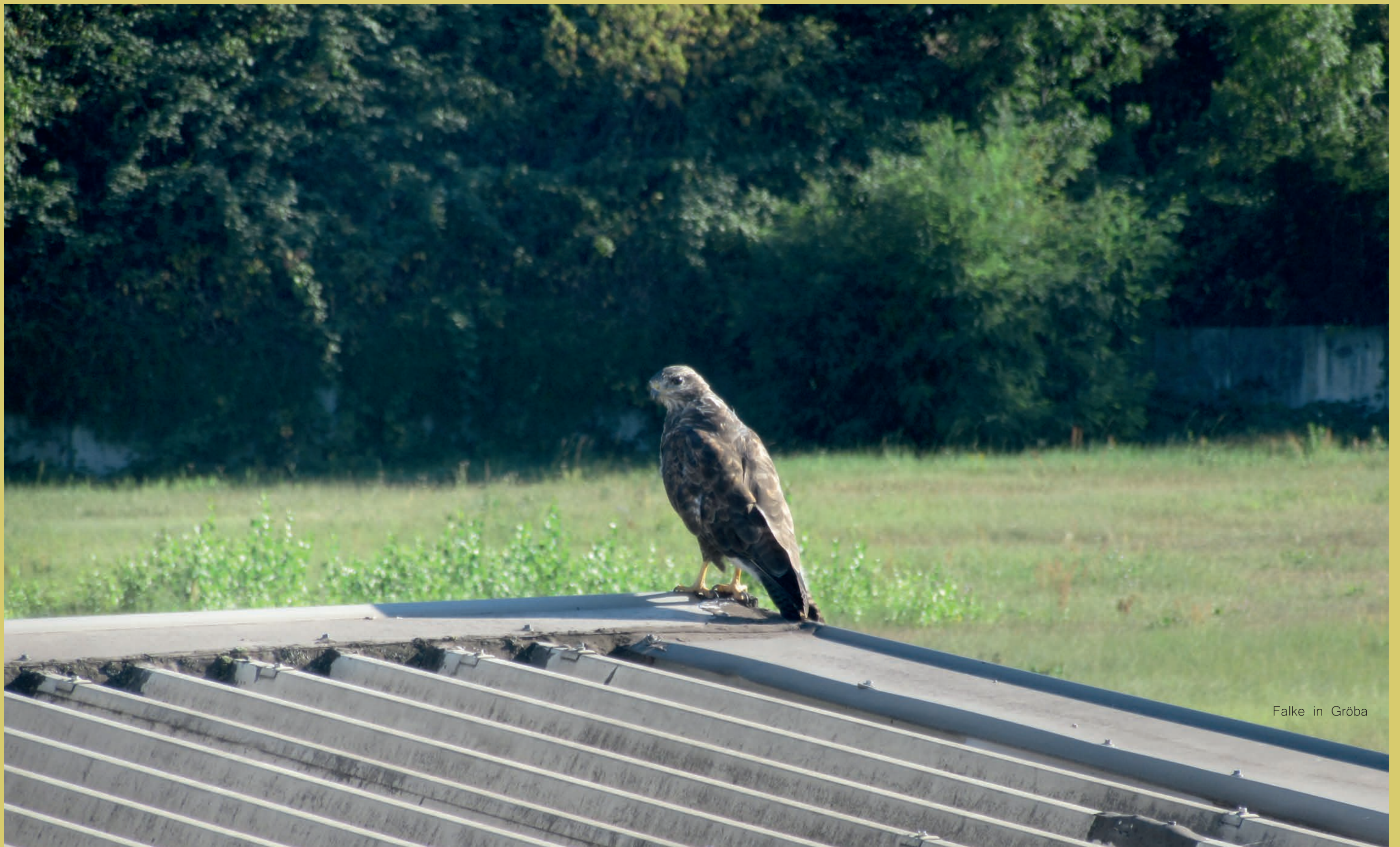
Falke in Gröba