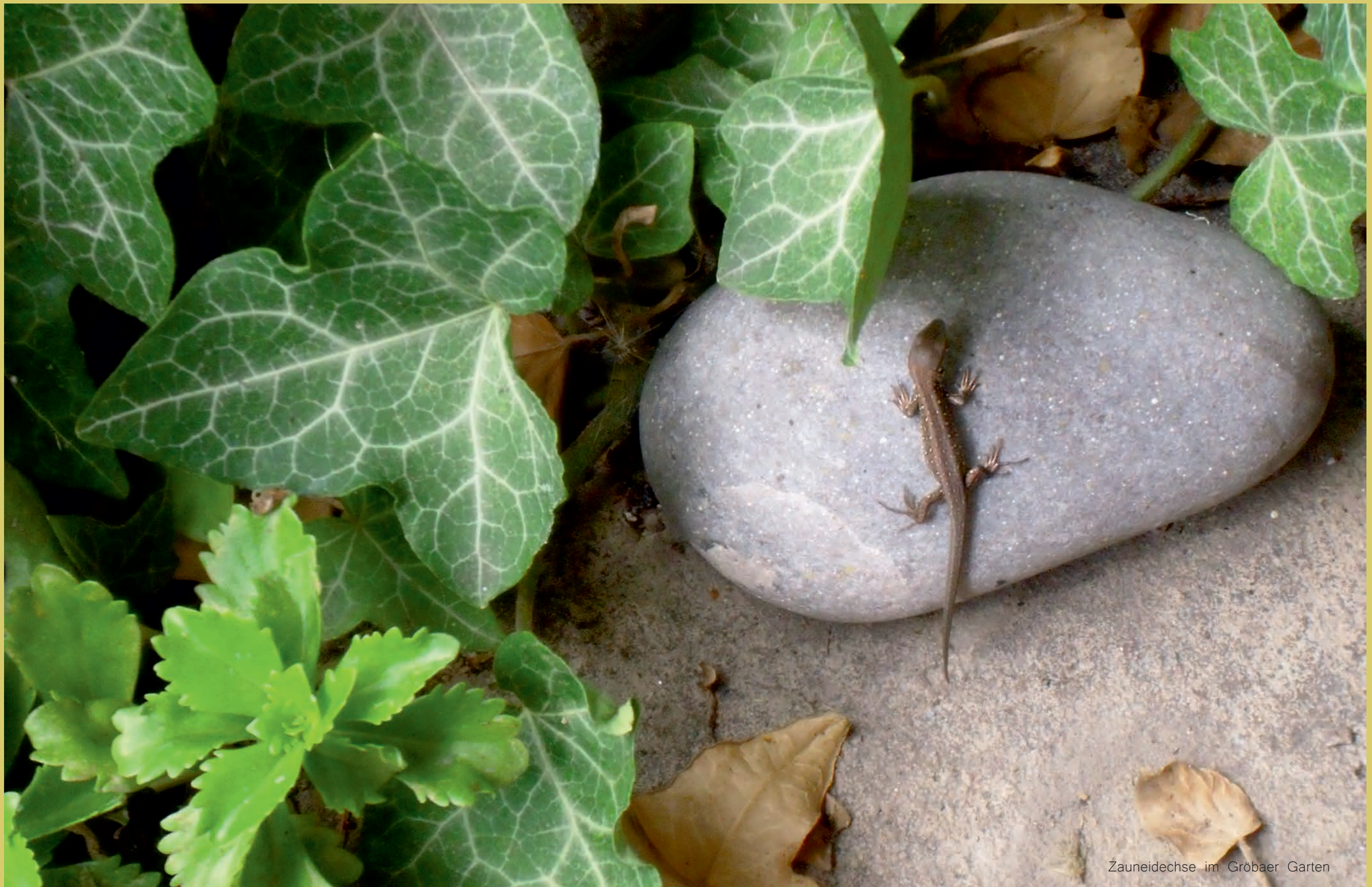
Zauneidechse im Gröbaer Garten