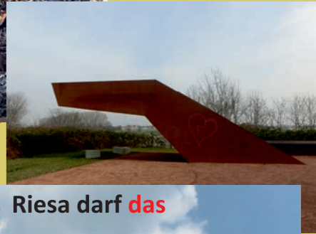
Riesa darf das